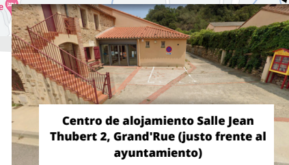
Centro de alojamiento Salle Jean Thubert 2, Grand'Rue (justo frente al ayuntamiento)